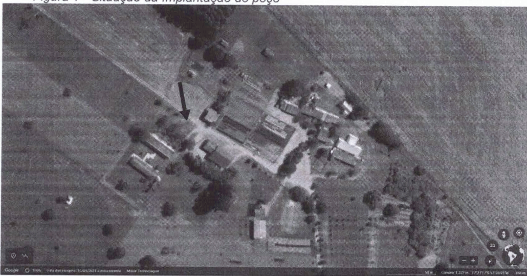
Figura 1 - Situação da Implantação do poço

O presente memorial descritivo tem por finalidade descrever as orientações necessárias para a implantação de um poço artesiano na Fazenda Experimental Luiz Eduardo Oliveira Sales, que suprirá a demanda de água de toda a área pertencente ao Centro Universitário de Mineiros.