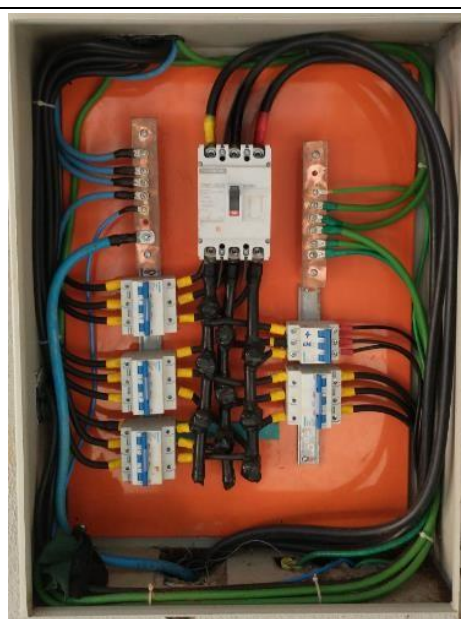
QDG2 – 150A