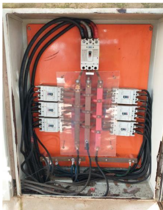
CAIXA DE PROTEÇÃO GERAL 250A BLOCO ADMINISTRATIVO 2