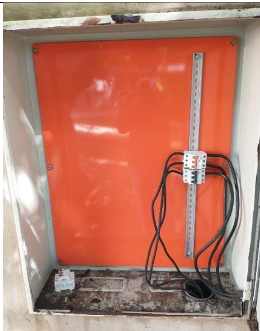
CAIXA DE PROTEÇÃO GERAL 250A BLOCO ADMINISTRATIVO 1 (ADEQUAÇÕES/LIGAÇÃO)